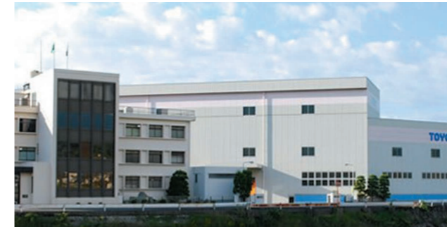
▲(株)トーヨ本社工場