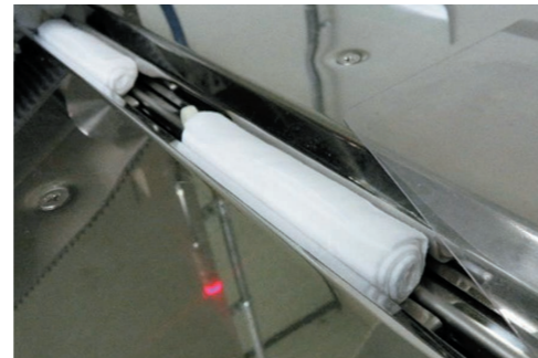
③薬液含浸して小さく巻く