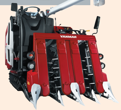
写真3 共同購入コンバイン「YH448AEJU」

乗用車のように、軽いハンドル操作で回した分だけ思いどおりに曲がるので、条合わせや四隅の枕刈り、隣接条への進入も簡単、スムーズに行えます。