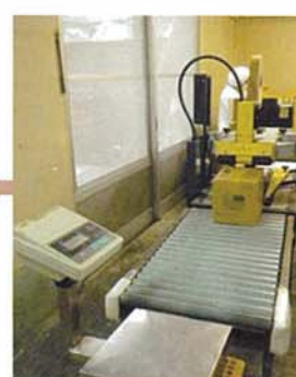
⑰箱詰め・ウエイトチェック