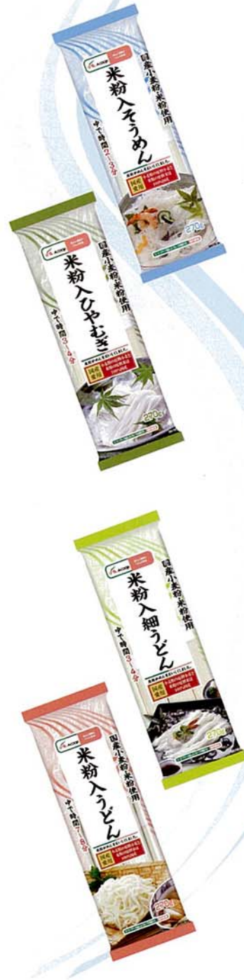
※2ページで紹介しているエコープ国産小麦粉・国産米粉使用乾麺シリーズとは別規格品です。