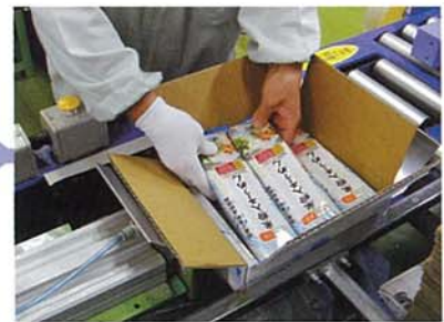
⑧印字チェック・段ボール箱詰め