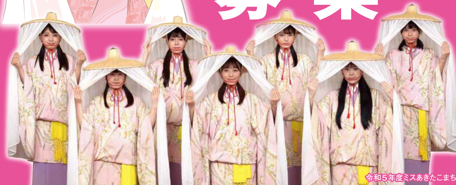
令和5年度ミスあきたこまち