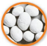
豆つぶ散布時の拡散の様子

豆つぶ剤は 自己拡散性に優れ、 10a当たりの散布重量は 1キロ粒剤の1/4 フロアブル剤の1/2 に抑えることができます。