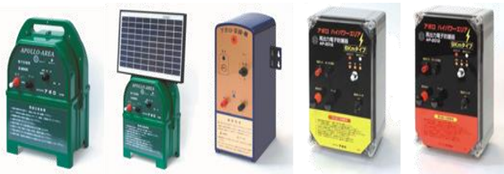
Z-3000 Z-3000-SR Z-600 菜園 AP-2012-6km AP-2012-9km