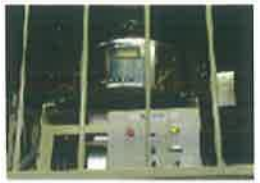
とせんぼう (糠玉除去装置)