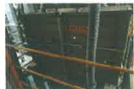
糠玉・大砕粒・小砕粒などを振動ふるいで選別除去します。