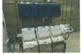
フルカラーCCDカメラにより、着色粒・青未熟粒・ガラス・石等を選別除去します。