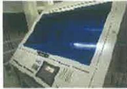
デジタル画像処理により、着色粒・糠玉・ガラス・石等を選別除去します。