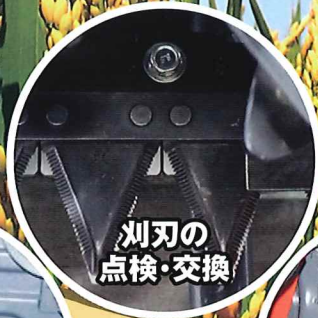
刈刃の 点検・交換