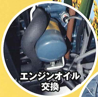
エンジンオイル 交換