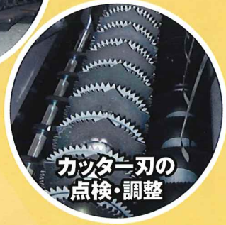
カッター刃の 点検・調整