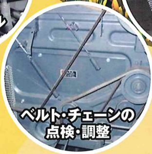
ベルト・チェーンの 点検・調整