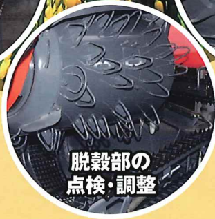
脱穀部の 点検・調整