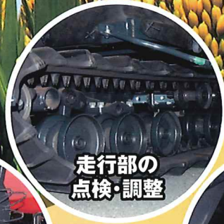
走行部の 点検・調整