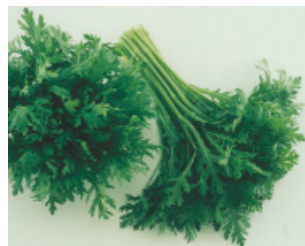
スティックシュンギク