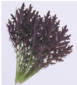
コーラルリーフ プルム