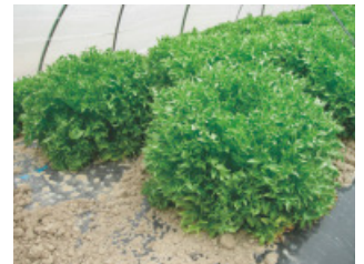
ハンサムグリーン