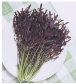
コーラルリーフ フェザー