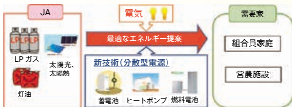
【図表1】 組合員への総合エネルギー提案イメージ