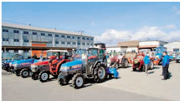
会場風景(郡山市 中央工業団地内)