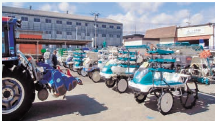
田植機が沢山並びました

昨年より100名を超える413名の来場者数となりました。また、成約金額は、10,124千円(税別)となりました。展示内容は、春の農作業用にトラクター、田植機、管理機を中心に取り揃えました。