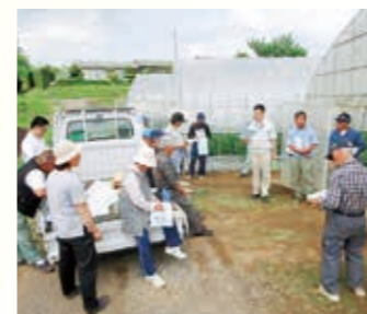
トマト現地指導会の様子

《JA夢みなみ しらかわ地区支援センターの取組事例》 作物のかり、リン酸等の過剰が問題になり、その対策として20数年前から長期栽培品目のトマト、キュウリ、ナスなどの果菜類を中心に土壌分析をし、施肥体系を見直すという指導会を、各支店単位に実施してきました。昨年度は肥料の費用で、概ねハウストマトで20%の減、ハウスキュウリで7%の減、露地キュウリでは土壌改良材の不足を補ったため10%増となりました。「土壌分析が必要な作物は何か」を常に考えて作物選定をしています。収量・品質には個人差があるので、栽培指導と土壌分析をセットで行い、生産者の生産性・所得向上のために、土壌分析を営農指導に活用しています。