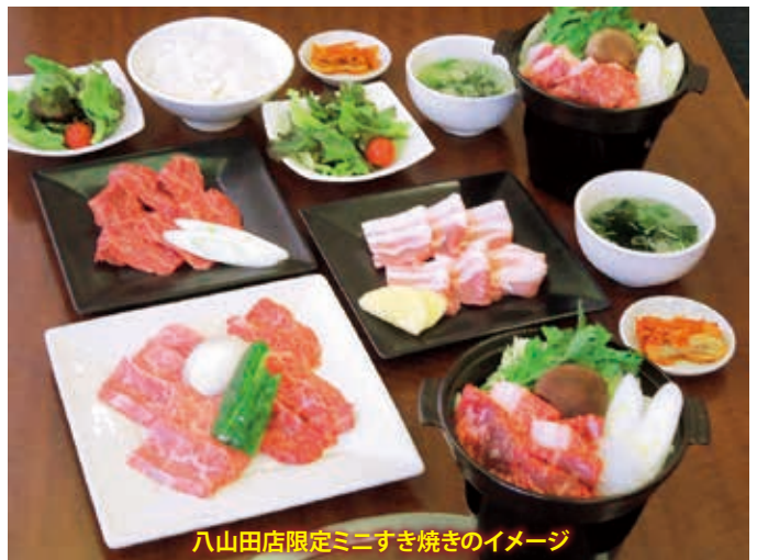
八山田店限定ミニすき焼きのイメージ