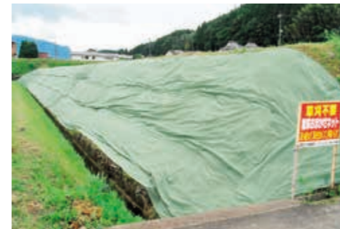
写真1: ネット設置時(夏は写真2のように膨らみますのでゆとりを持って張ってください。)