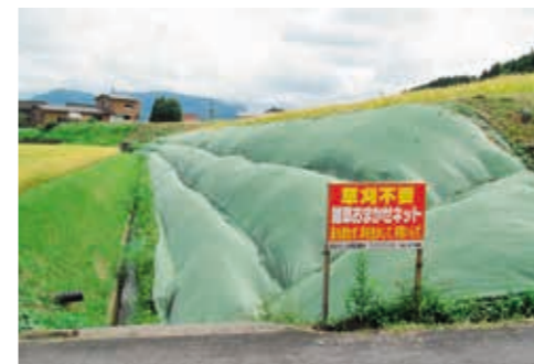
写真2: 夏の状態(ネットの下で雑草が繁茂しかまぼこ上に膨らみますが、冬になると草が刈られて写真1の状態に戻ります)