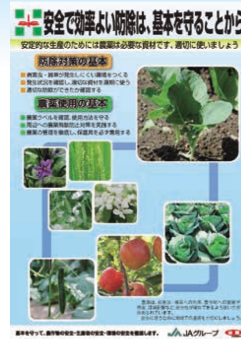
安全防除啓発の配布チラシ

この運動は、農薬取締法、毒物劇物取締法、食品衛生法などの関係法令にもとづいて「農薬の安全と適正使用、その保管管理、環境に配慮した農薬の使用、そして、適正販売などについて、周知徹底することにより、農薬使用者の方々や家畜・蜜蜂などへの危害防止」を目的とする運動です。 運動期間は農作物への防除が本格化する6月10日から9月10日までの3ヶ月間となっております。特に県の重点事項は、(1)農薬散布等計画の周知の推進(2)航空防除の安全確認の徹底(3)農薬の適正使用の徹底となっております。 JAGグループでは、ポスターやチラシを配布し、農薬の適正使用と適正販売などの啓発に努めております。 また、昨年より「短期暴露評価」の新たな制度が導入されたことで適用作物の使用が削除された農薬もあり当該農薬の使用については特にご留意願います。