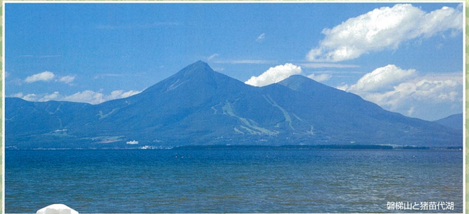
磐梯山と猪苗代湖