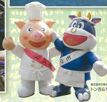
東京食肉市場キャラクター トン吉&モウ太