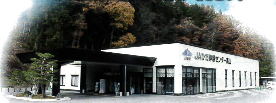
見学会場(葬祭センター高山)案内図