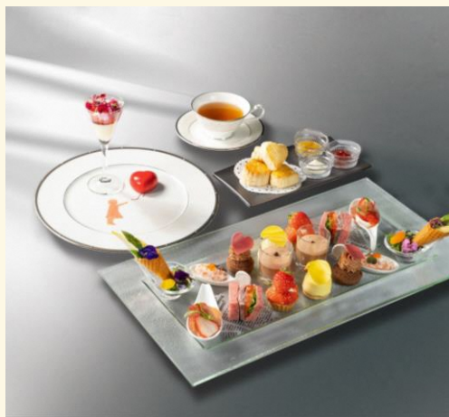
【1月20(木)~3月14日(月)】 スカイアフタヌーンティー "Love is ... ?" ¥4,200