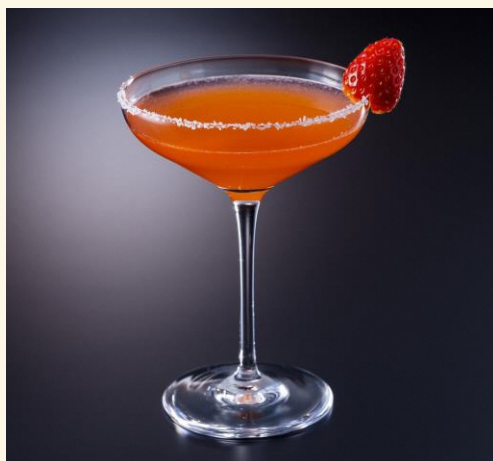
【2月15日(火)~3月14日(月)】 岐阜県産いちごのマルガリータ ¥2,300