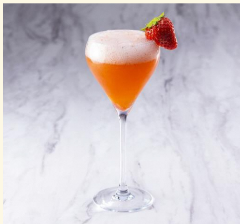
【1月20日(木)~3月14日(月)】 岐阜県産いちごのレオナルド ¥2,200