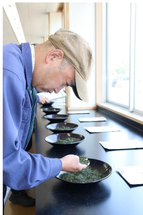
昨年の初共販会の様子