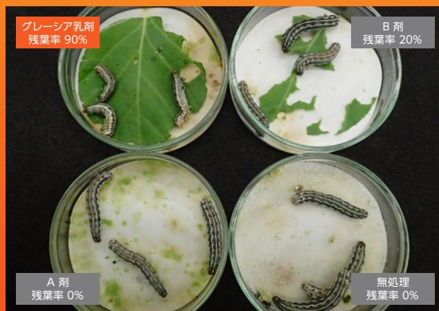
2018年 日産化学生物科学研究所（社内試験）【試験方法】虫体浸漬、処理1時間後投入、20時間後撮影