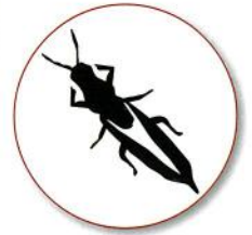
〈アカメガシワクダアザミウマ成虫〉