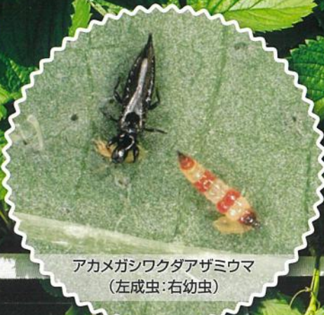
アカメガシワクダアザミウマ (左成虫:右幼虫)

アカメ®は、 アザミウマ類の天敵である アカメガシワクダアザミウマを 製剤化した製品です。