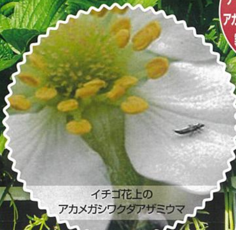
イチゴ花上の アカメガシワクダアザミウマ