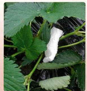
(写真上:イチゴ本圃での設置の様子)