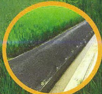
おまかせネット(黒)