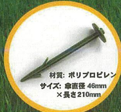
材質: ポリプロピレン サイズ: 傘直径 46mm ×長さ 210mm