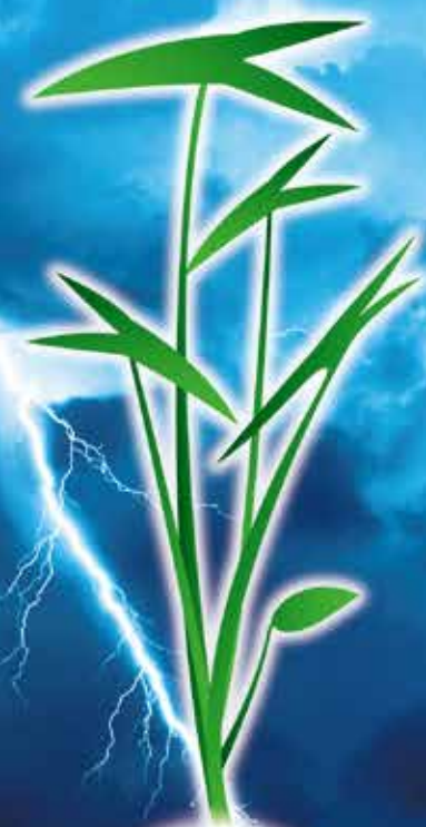
沢瀉 オモダカ 矢尻葉4葉期まで