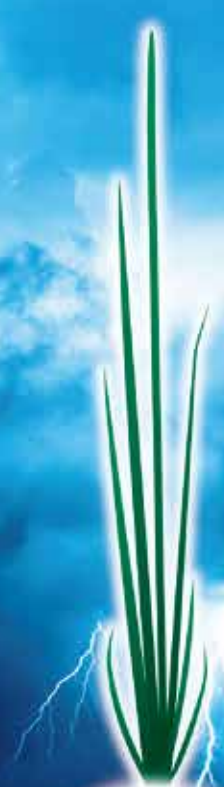
蚩藺 ホタルイ 草丈20cmまで