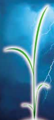
野稗 ノビエ 4葉期まで