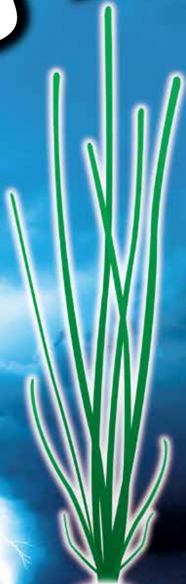
黒慈姑 クログワイ 草丈30cmまで