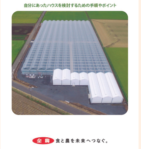
全農 食と農を未来へつなぐ。