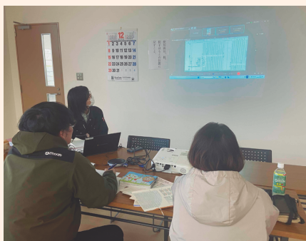
写真1 ハウス仕様の打ち合わせ