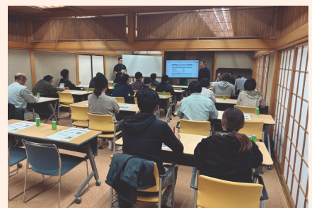
写真2 ハウス講習会

しい状況のなか、この講習会は、自らができることの第一歩として、生産者の皆さんの発案で実施されました。事前に産地のハウス視察を行い、当資料の考え方に沿って特徴や改善したい点を整理し、勉強会のまとめとして、今後新設する際の改善イメージを共有しました。