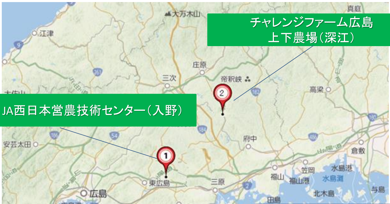
JA西日本営農技術センター(入野)

令和2年3月開設、就農時と同規模の経営面積(ハウス 約31a)で、アスパラガスの実践的な経営を目的とした研修施設です。基礎研修後、就農前の1年間、実際に農場を運営し、栽培技術だけでなく、収支管理や労務管理も含めた農業経営能力の強化を行います。