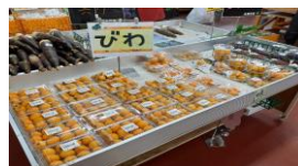
(品目) (規格) (販売価格)

葉菜類 は、ほうれん草、白ねぎ、青ねぎ、サラダ水菜など、全体的に出荷が少なめです。赤しそが出荷されていますよ！ 山菜類 は、ふき、わらびの出荷が多く、こごみ、たらの芽の出荷が少なめです。 根菜類 は、玉ねぎ、馬鈴薯、にんにくの出荷が多く、大根、人参、小かぶ、ごぼうなどの出荷が少なめです。 果菜類 は、トマト、ミニとまと、きゅうりの出荷が多く、なす、水なすの出荷が少なめです。 豆類 は、モロコシ豆、いんげん豆の出荷が多く、えだまめ、きぬさや、ぶんどう豆、スナップえんどうの出荷が少なめです。 柑橘類 は、出荷が終盤を向かえているため、販売台に物が無い状況になっております。びわとうめいの出荷がかなり増えてきましたよ！！