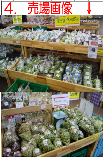
レアベジタブルの売り場画像

3. レアベジタブル レアベジタブルとは珍しい野菜や面白い野菜を売場にてご紹介しています。今週は・・・ ○アイスプラント ○大根の実 ○コールラビ ○野菜パパイア ○ふだん草・ケール 調理の仕方多种多样ですが中でも コールラビ 人気♡