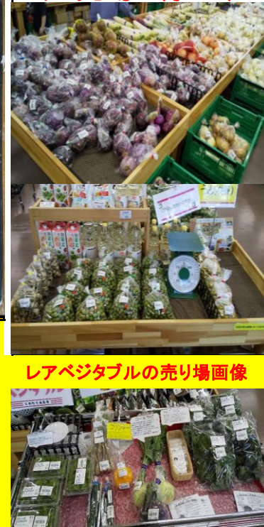
レアベジタブルの売り場画像

Instagramをはじめました! Followお願いいたします → @genkitonari