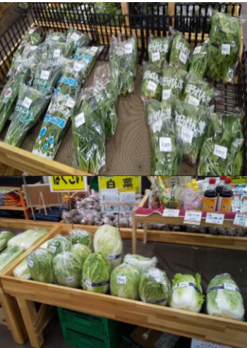
レアベジタブルの売り場画像