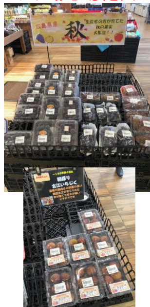
☆産直スタッフからお知らせ