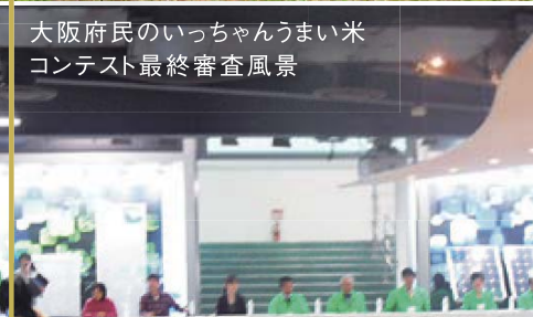
大阪府民のいっちゃんうまい米 コンテスト最終審査風景