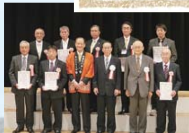
すし米コンテスト・国際大会「すし米大賞」授賞式