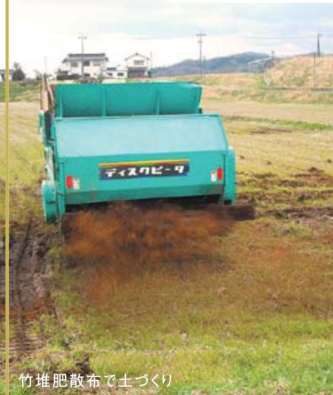
竹堆肥散布で土づくり