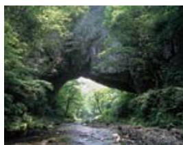
雄橋（国の天然記念物）