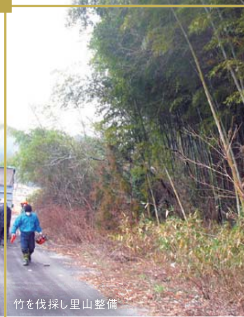
竹を伐採し里山整備