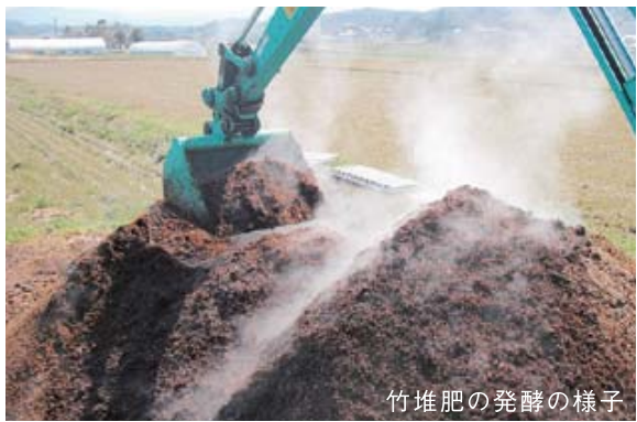
竹堆肥の発酵の様子

庄原市山内地区は古くから米どころとして栄えた自然豊かな地域です。「里山の夢」の米作りでは、里山の整備で伐採した竹を粉末にし、独自