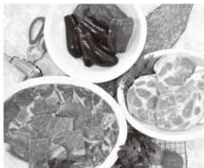
▲どきどきのバーベキューは茨城のブランド肉やメダルソーセージ新鮮野菜付き

バーベキューシーズン到来!手ぶらで気軽にバーベキューが楽しめる、くぬぎの森のバーベキューコーナーは屋根付きの全天候型。ご予算で選べるコースは、ライトコース(お一人様1,600円)、ベーシックコース(お一人様2,400円)、人気の常陸牛コース(お一人様3,800円)と海鮮コース(お一人様1,600円)の4コース。茨城のブランドお肉のコースはどきどきならではの、さらに海鮮を組合せるとリッチなバーベキューも楽しめます。最大100名までご利用できるので団体様にも好評。ご利用時間は11時から15時の間で2時間。完全予約制なので2日前までにお申し込みください。