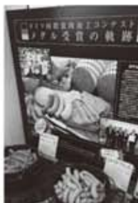
▶第3週の週末は 金メダルソーセージ が特別メニューで登場!

ブッフスタイルで人気の家庭料理レストランでは、どきどき茨城町店20周年記念キャンペーンの月替わり特別メニューのひとつとして、4・5・6月の毎月第3土・日曜日、ハム・ソーセージの国際コンクール(IFFA)で金メダル受賞のソーセージが登場します。この機会に本場が認めた本物の味どきどきハム・ソーセージ工房の手作りソーセージをぜひご賞味ください。レストランのお料理は、旬の食材をふんだん使い化学調味料を使わず調理していますので、お子様からお年寄りまで安心してお召し上がりいただけます。