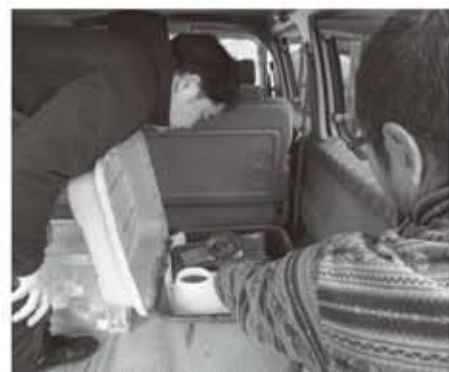
▲後ろの荷物室の箱の中が天ぷら油のタンク。