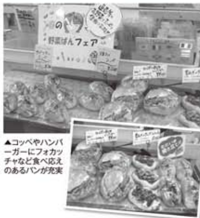
▲コッペやハンバーグにフォカッチャなど食べ応えのあるパンが充実

パン工房では、直売所に並んでいる旬の野菜を使った「春の野菜パンフェア」を5月末まで開催しています。旬のレタスがたっぷりのローズポークと常陸牛のハンバーグはハム・ソーセージ工房特製のハンバーグを使用。青ネギのサルサ、玉ねぎとベーコンのフォカッチャ、他にも焼きそばやナポリタンのコッペなどボリュームのあるパンが揃いました。旬の野菜にあわせた新商品も登場しますのでご期待ください。