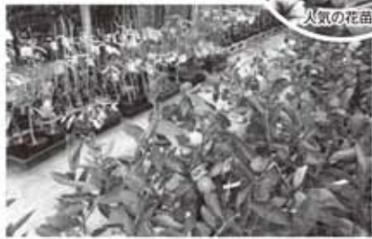
▲樹苗はコーナーを移設