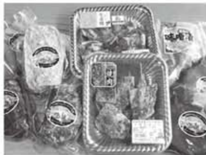
人気の「常陸牛」と「ロースポーク」の 茨城県産ブランド肉が原材料。 調理も簡単、お弁当にも最適な美味しい品々

精肉・ハム&ソーセージ工房ではこの春から新生活を始める方、新たな環境でスタートする方を全力で応援する新生活応援コーナーが登場。フライパンで炒めるだけの茨城県産黒毛牛常陸牛の味付け肉や、茨城県産銘柄豚ロースポークの生姜焼き、塩麹漬け、味噌漬け、湯煎もオーケーのロースポーク常陸牛ハンバーグやどきどきフランク、パンにはさんでも美味しいフライシュケーゼ、切り出して食べられるロースポークチャーシューやももハムなど手軽で調理も簡単、お弁当にも最適な品々を集めました。どきどきの美味しいお肉やハム・ソーセージを上手に使って楽しい新生活を!