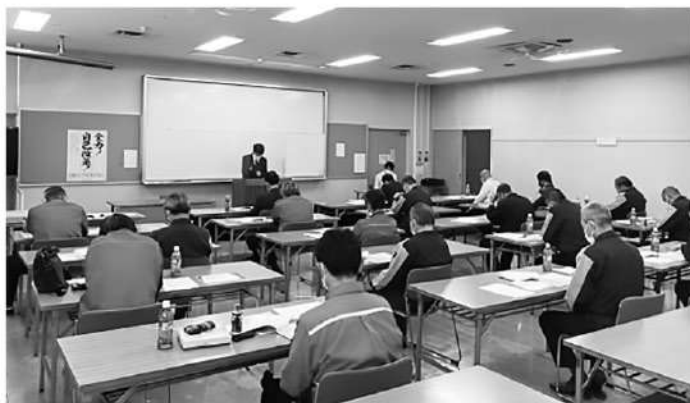
外部講師による容器流出防止について

参加者は組合員にLPGガスを安心してお使いいただけるよう、これからも保安の確保と安全運転の励行を確認したほか、無事故無違反表彰を行い、以下の方が受賞されました。