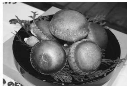
過去最高値26万円で競り落とされた「のとてまり」プレミアム

奥能登原木しいたけ活性化協議会では、今年度の「のとてまり」、「のと115」の出荷目標を38,000玉としており、3月末までの出荷を予定しています。