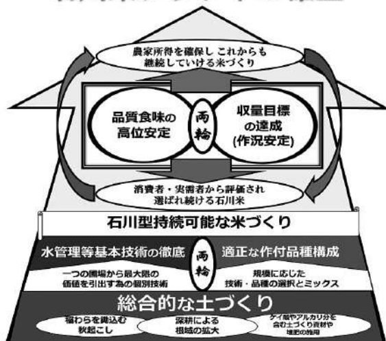
図. 本運動が目指す姿