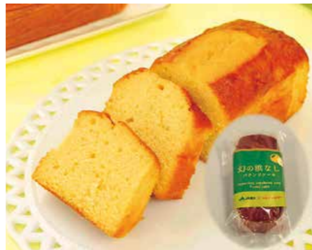
再販する「幻の浜なしパウンドケーキ」

1個、税込756円。JA横浜直売所「ハマッ子」にて販売する。加工品としての展開により、ブランドの知