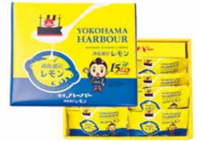
レモン丸ごとの風味が味わえる「横濱ハーバー 湘南潮彩レモン」

JAかながわ西湘は国産レモンのブランドとして「湘南潮彩レモン」の産地確立を目指している。JA全農かながわでは、今後もこのような県内農畜産物の認知度向上・ブランド力向上に向け、一次加工品を原料とした商品開発・販路拡大等を進めていく。