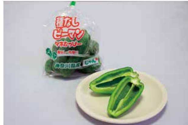
種がなく、肉厚で苦味が少ない「種なしピーマン」

種なしピーマンは調理のしやすさや品種の珍しさから注目度が上がり、テレビや新聞等メディアの取材も