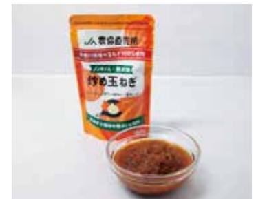
市販品は県内JA直売所で販売中

今期分で2.6トン（加工後ベース）を供給予定。冷凍品から常温品に切り替わったことで扱いやすくなったと好評であり、「今後、市町村給食会に商品を浸透させ、年々使用量が増やせるよう提案していきたい」と生活課は抱負を話す。