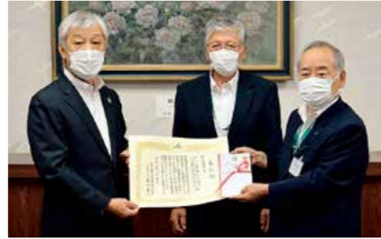
特別優秀賞のJAさがみ

施設部では今後も「資産管理事業の総合事業としての日常化」の周知・浸透、「経営のメンテナンス」の取り組み強化に取り組んでいく。