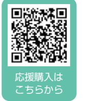
応援購入はこちら