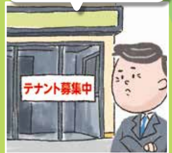
テナント・マンション