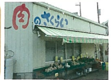
【肉のさくらい本店】