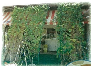
【素朴な店構えの店内

販売を始めたきっかけは、近所の方々にお肉を配った時に豚肉の美味しさに驚きと喜びを表していただき、「おいしい豚肉を皆様にお届けしたい」という思いから平成7年に『みーとはうす KANEKO』を開店することにしました。しかし、開店当初の3年程は苦労の連続、その後ソーセージ教室を開催するなどして、少しずつ口コミで評判が広がり、20年目の今ではお客様の9割がリピーター。開店当時、お母さんに連れられて来ていたお子様が親となってまたお子様を連れてきてくれているという、世代を超えたリピーターもいるようです。