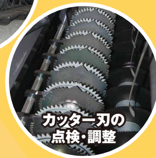
カッター刃の 点検・調整