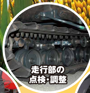
走行部の 点検・調整