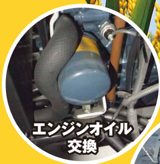
エンジンオイル 交換