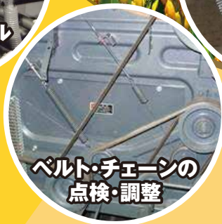
ベルト・チェーンの 点検・調整