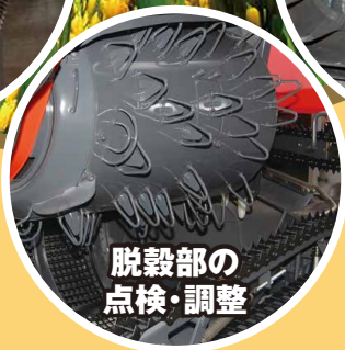
脱穀部の 点検・調整