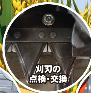
刈刃の 点検・交換