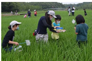
■ 田んぼの生き物調査