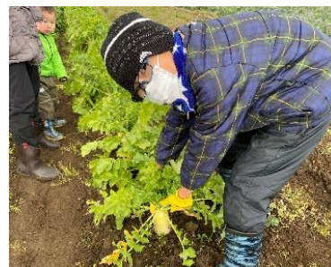
■ おでん大根収穫体験