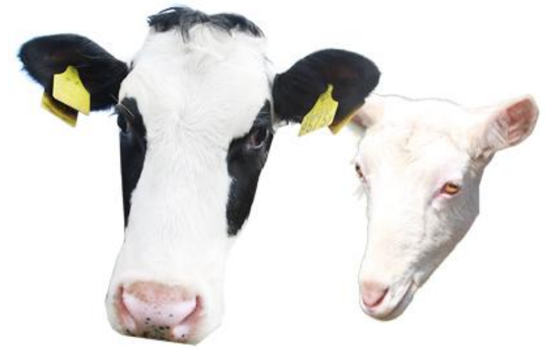
うし80とう やぎ2ひき