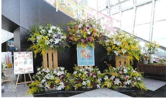
【にいがたユリフェア（令和4年7月）】