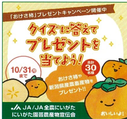
【おけさ柿 プレゼントキャンペーン】 （令和4年10月11～31日）