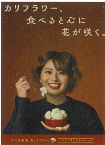
■ ポスター（カリフラワー）