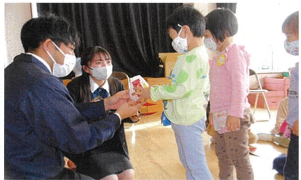
【食育活動（ル レクチェ）】 （令和4年11月）