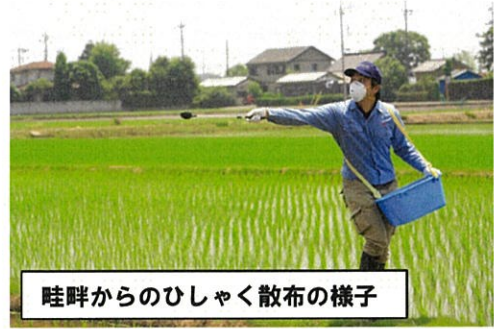
畦畔からのひしゃく散布の様子