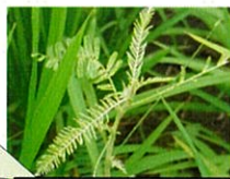
クサネム白化症状