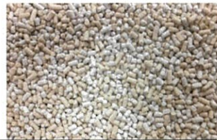
エアー粒剤イメージ写真