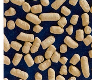
豆つぶ剤イメージ写真