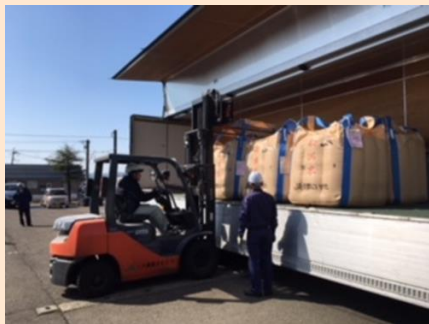
物流の人手不足にも対応