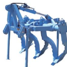
カットブレーカー（2列、オプション3列） (農研機構農村工学研 北川氏より)