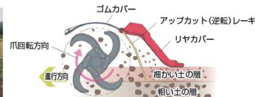
イラスト引用：小橋工業HPより