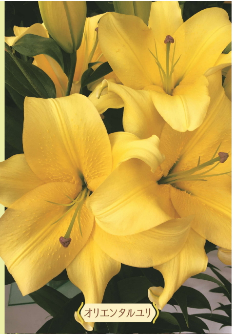
《オリエンタルユリ》