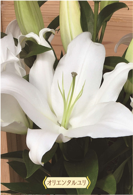
《オリエンタルユリ》