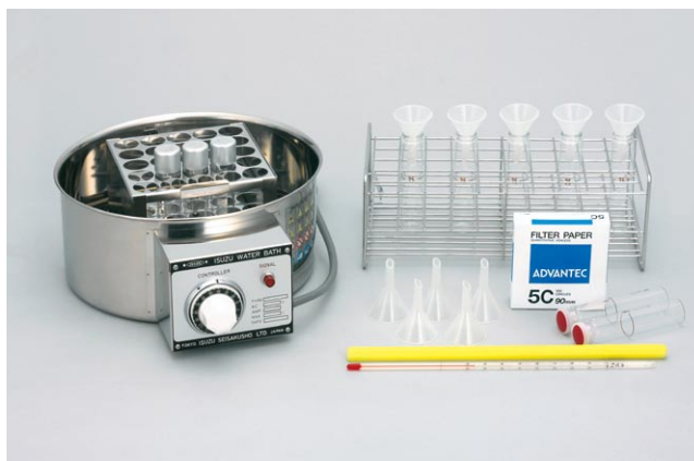
ケイ酸分析器具セット (オプション)