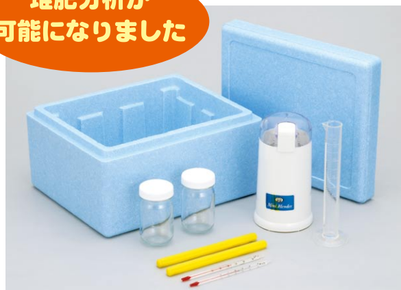
堆肥分析器具セット (オプション)