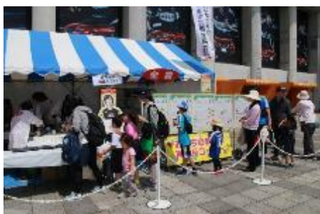
焼き餅配布の様子(2019年5月JA全農チビリンピック2019)

餅は持久力を必要とするスポーツにピッタリの食材。限定500個の焼き餅を2日間、無料配布します。