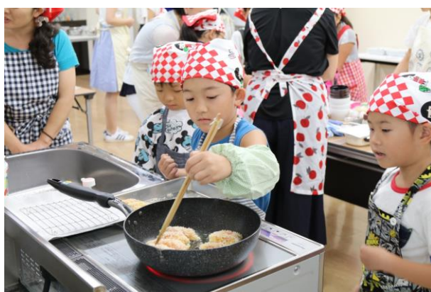
一人で揚げ物にも挑戦！