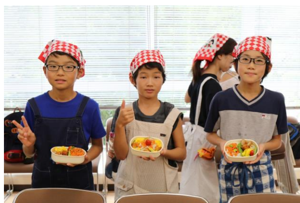
上手にできました