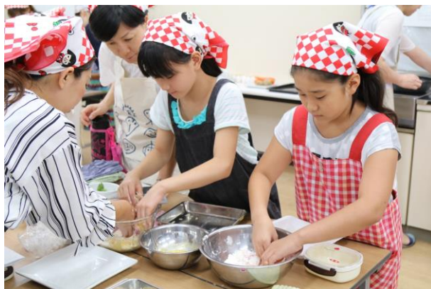
友だちと一緒に協力して作業します

教室では、本会職員や各グループ会社社員から日本の農業、食材などの話や食育クイズをおこない、参加者に農業や食の大切さを伝えています。