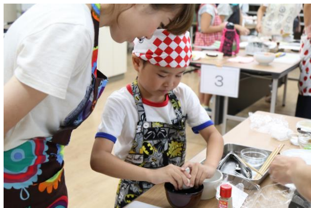
自分で卵割りをします