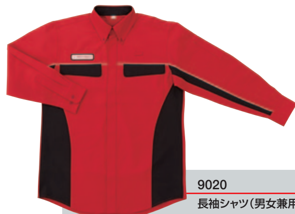
9020 長袖シャツ(男女兼用)