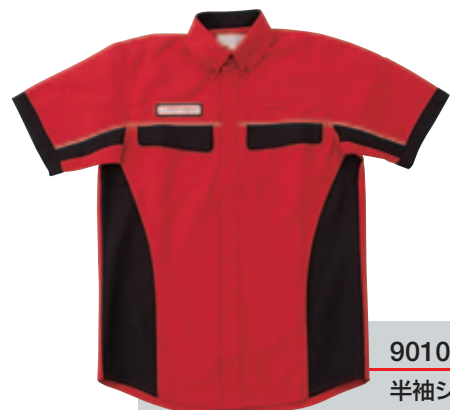
9010 半袖シャツ(男女兼用)