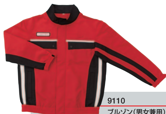
9110 ブルゾン(男女兼用)