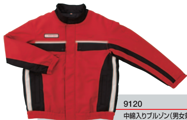
9120 中綿入りブルゾン(男女兼用)