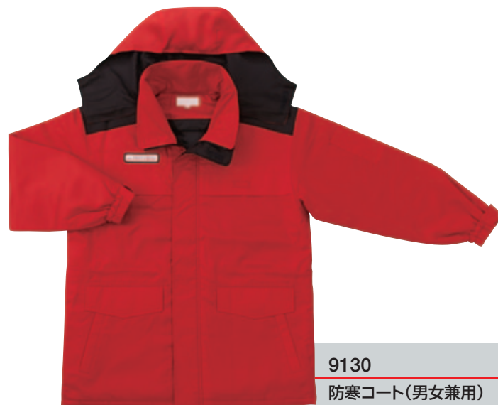
9130 防寒コート(男女兼用)