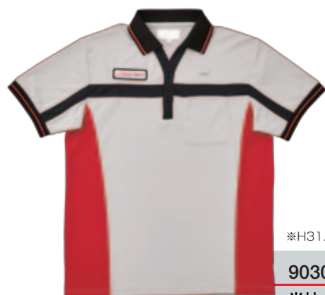
※H31.4~新デザインへ変更予定 9030 半袖ポロシャツ(男女兼用)