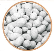
豆つぶ250製剤 (実物大)