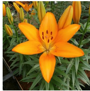
グラストンバリー