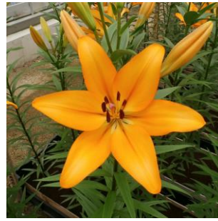
インディアンダイヤモンド